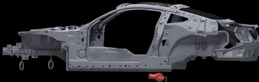
Mesures de soubassement