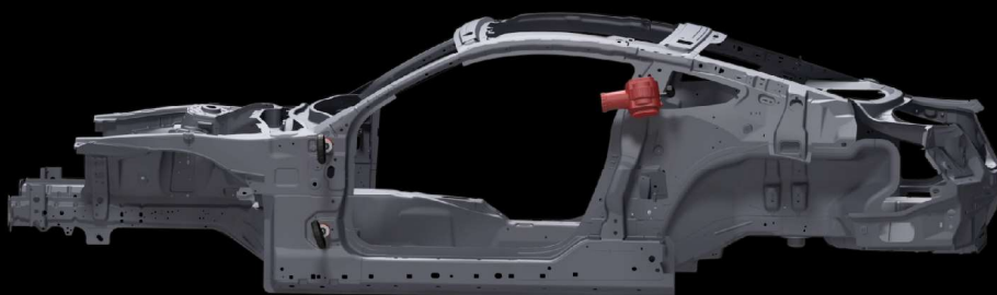
Mesures de points latéraux